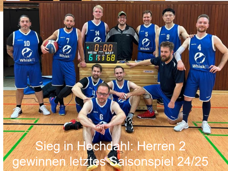
Sieg in Hochdahl: Herren 2 gewinnen letztes Saisonspiel 24/25