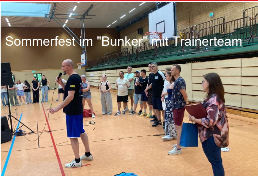
Sommerfest im "Bunker" mit Trainerteam