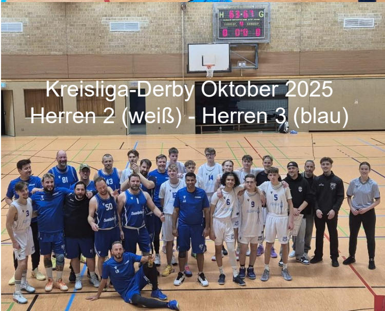
Kreisliga-Derby Oktober 2025 Herren 2 (weiß) - Herren 3 (blau)